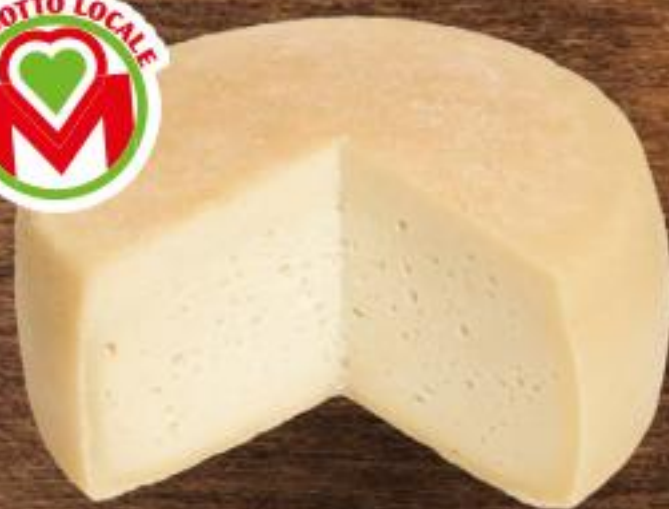
1,89 PECORINO LOCALE all'etto