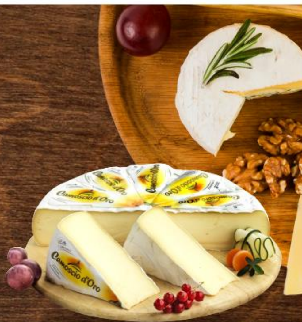
1,39 CAMOSCIO D'ORO all'etto