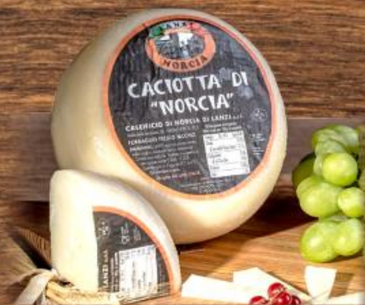
1,59 LANZI Caciotta di Norcia all'etto