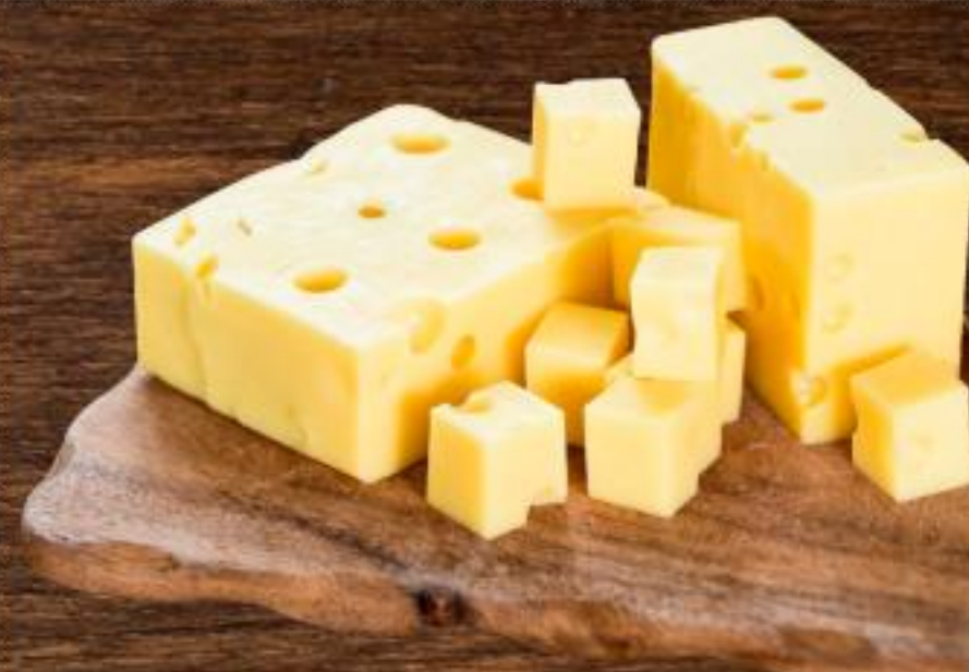
0,79 EMMENTAL FRANCESE all'etto