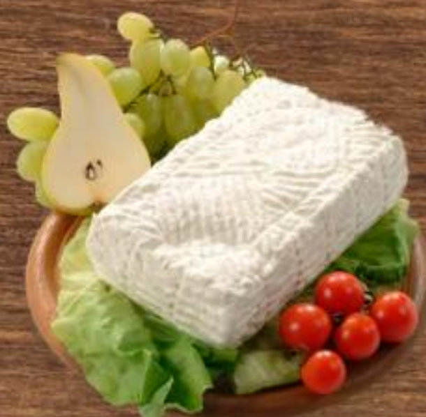
1,29 GIUNCATA SPIGA all'etto