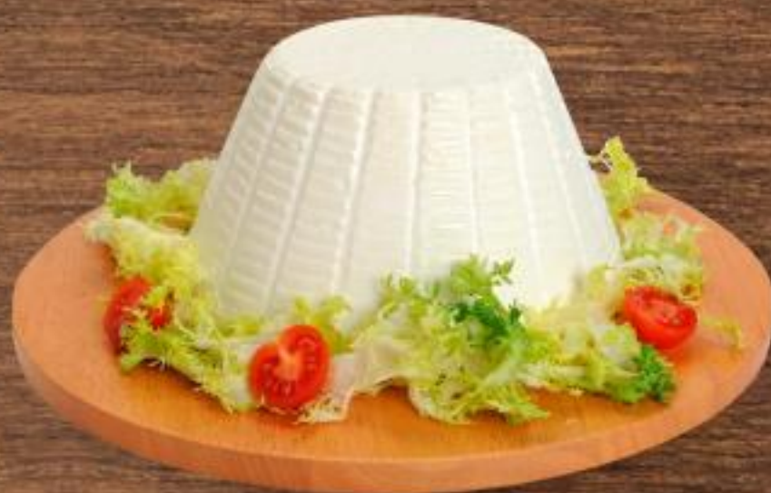
0,85 RICOTTA di pecora Colline marchigiane all'etto