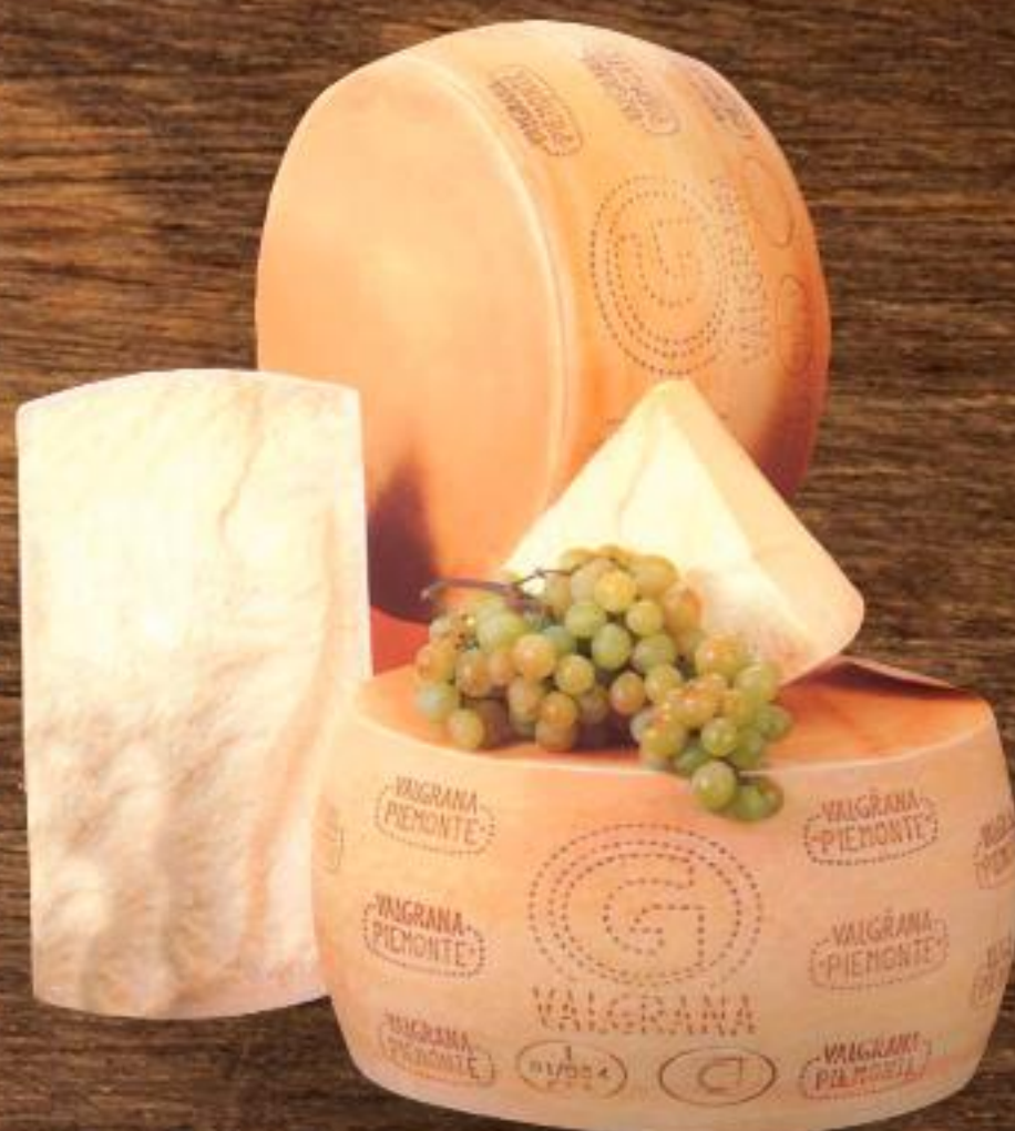
0,99 VALGRANA Formaggio piemontino all'etto